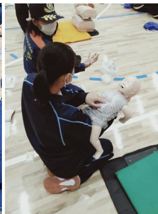
実技「気道異物除去法(乳児)」